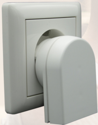
Produkt eingesteckt in 55er Gira Steckdose

Für die Dimmfunktion sind bei Energiespar- und LED-Leuchten dimmbare Leuchtmittel zu verwenden. Je nach LED-Leuchtmittel kann es zu Nachleuchteffekten im ausgeschalteten Zustand kommen.