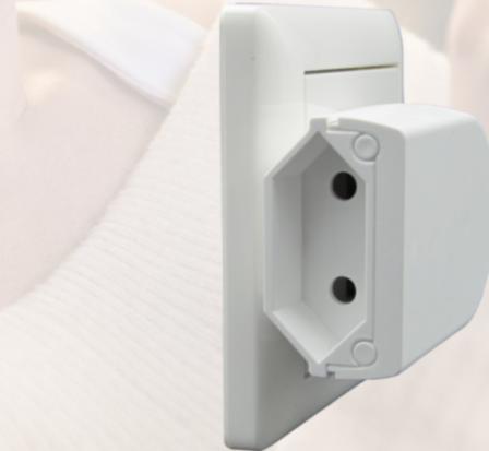
digitalSTROM ist eine eingetragene Marke der Digitalstrom AG

Sollte der IC GE-ZWD300 nicht für Licht sondern zum Schalten für Kleingeräte genutzt werden, so sollte im dS System hierfür ein eigener RAUM definiert werden, z.B. Wohnzimmer Steckdose. Damit kann man im Konfigurator den Stecker von der Funktion Licht abkoppeln. Durch die Betriebsart "gelb" im dS System wird der Ge-ZDW300 automatisch in die Funktion kommen/gehen eingebunden. Möchte man das nicht, so kann dies unter Geräteeeigenschaften verändert werden.